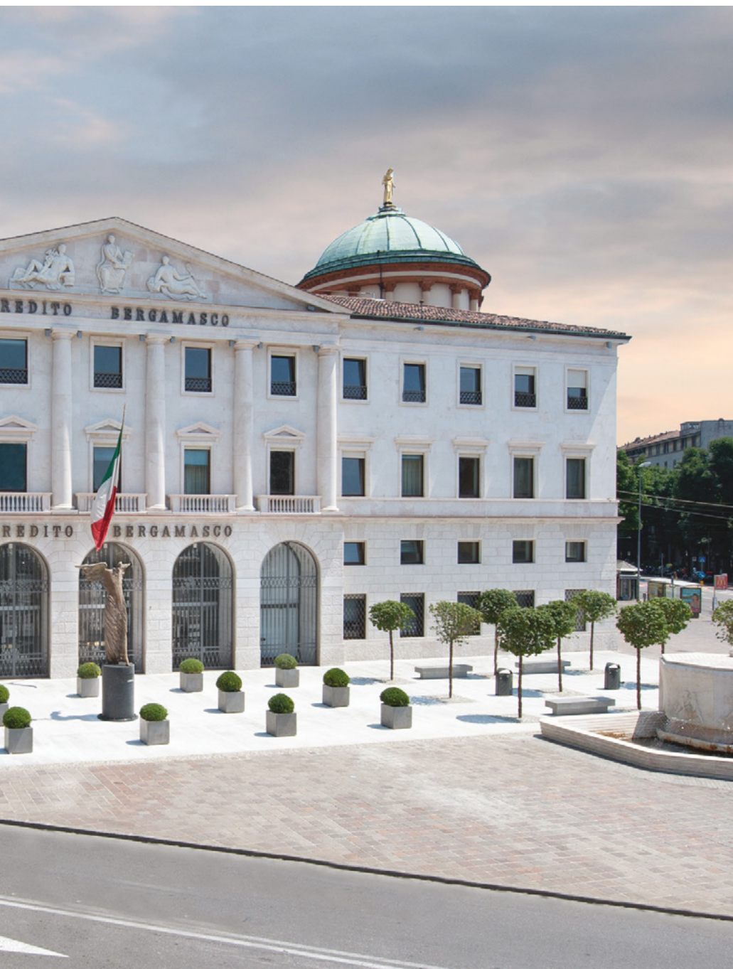
Sede della Fondazione Creberg in Largo Porta Nuova 2