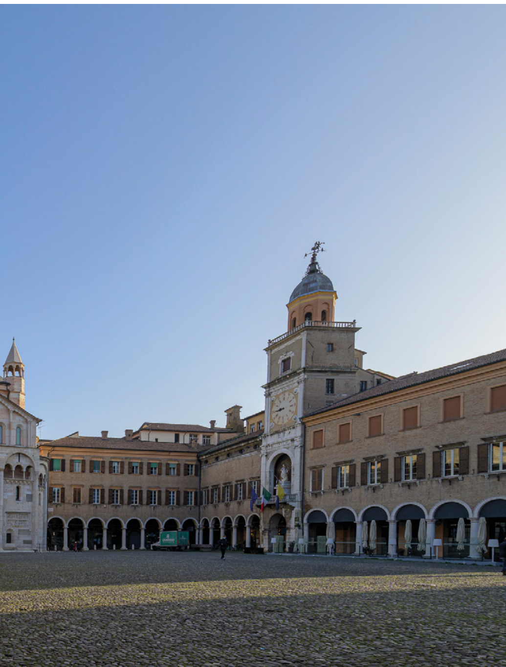
Piazza Grande Modena