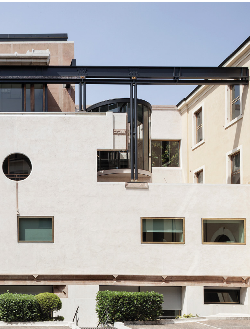
Palazzo Scarpa sito in piazza Nogara, sede della Fondazione BPV