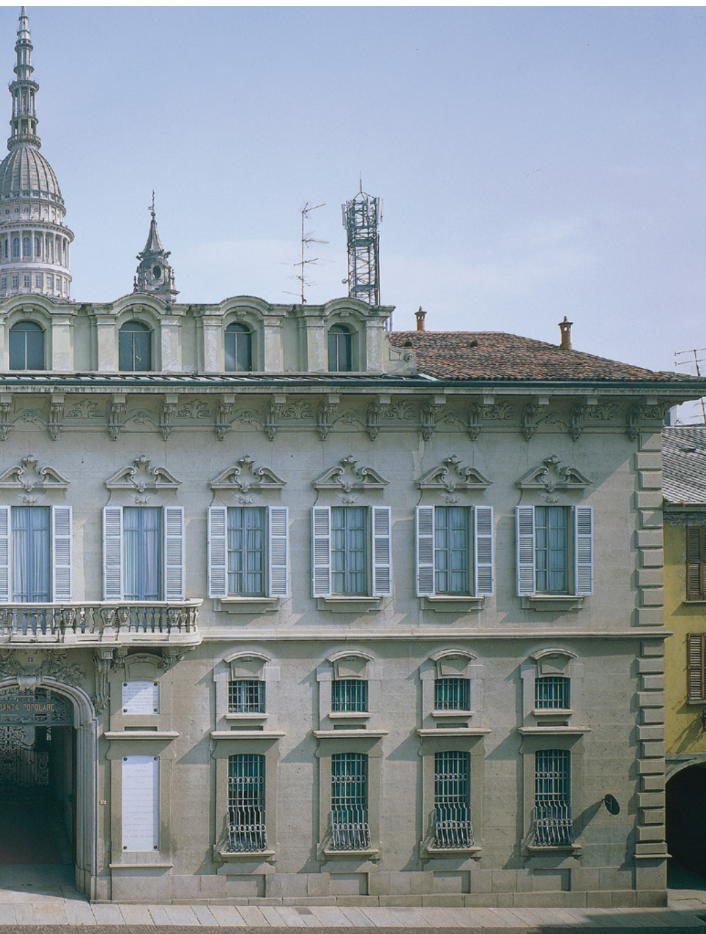
Palazzo Bellini sito in Via Carlo Negroni 12, sede della Fondazione BPN