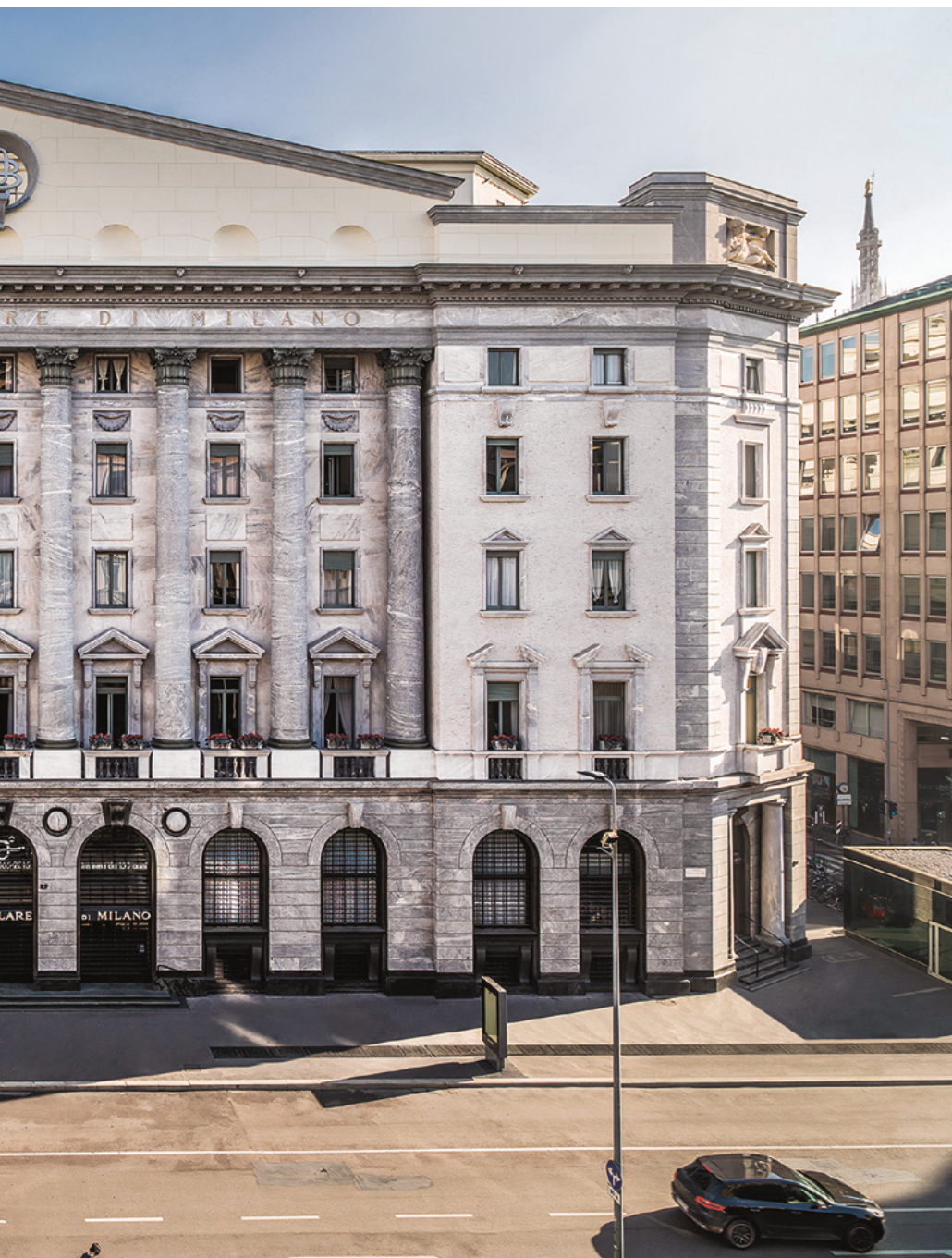
Palazzo della Banca Popolare di Milano sito in Piazza Filippo Meda 4, sede della Fondazione BPM